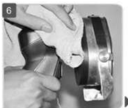
Удаление влаги с модели KS100E

5. Смойте дезинфицирующее средство с ножа и предохранителя. ▶